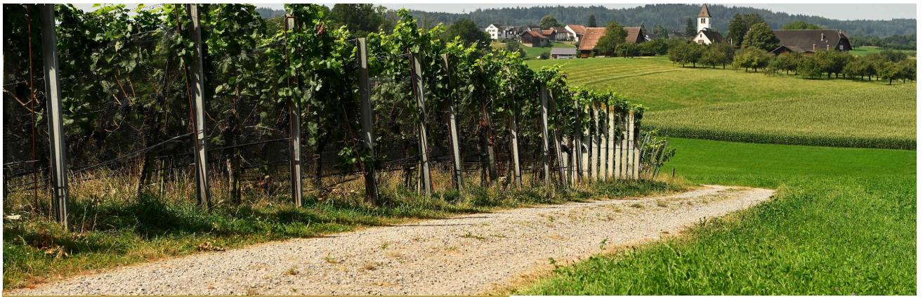
Fachtagung Ressort Politik und Führung